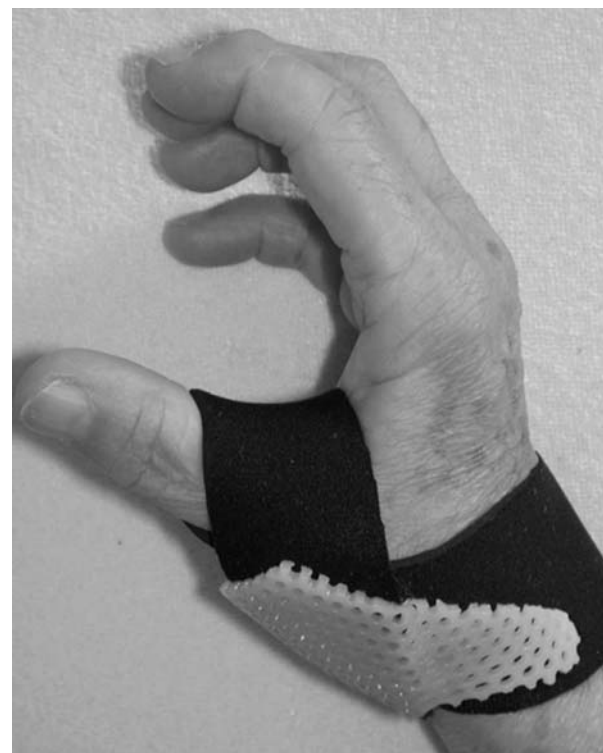
Figura 3. Tutore funzionale in neoprene.