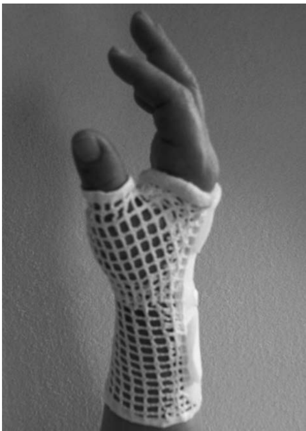
Figura 1. Tutore di riposo in termoplastico notturno.

economia articolare, supportate da esempi pratici e da un promemoria fotografico (13).