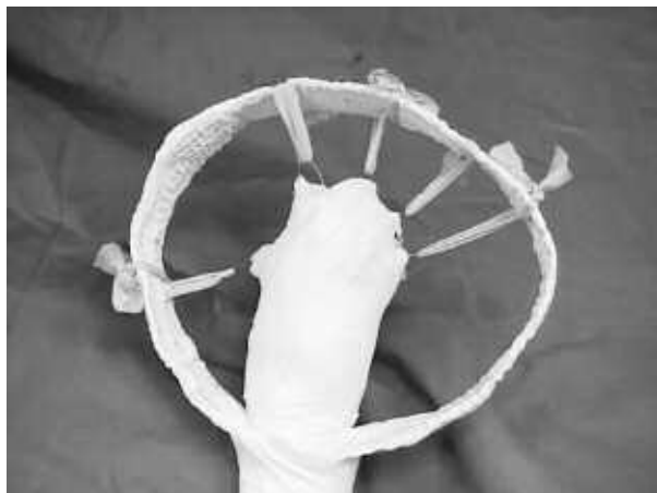
Figura 3. Tutore a racchetta.