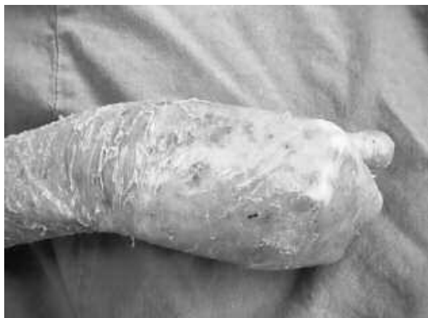
Figura 1. Mano chiusa in flessione, prima dell'intervento.

Non è possibile prevenire conservativamente le deformità della mano indotte dall'EB, pertanto il protocollo riabilitativo è solamente post-chirurgico e data l'elevata tendenza alla recidiva della patologia, solo l'uso corretto e prolungato dei tutori associati ad una corretta riabilitazione, consente di posticipare la naturale tendenza alla flessione delle MF e delle IF.