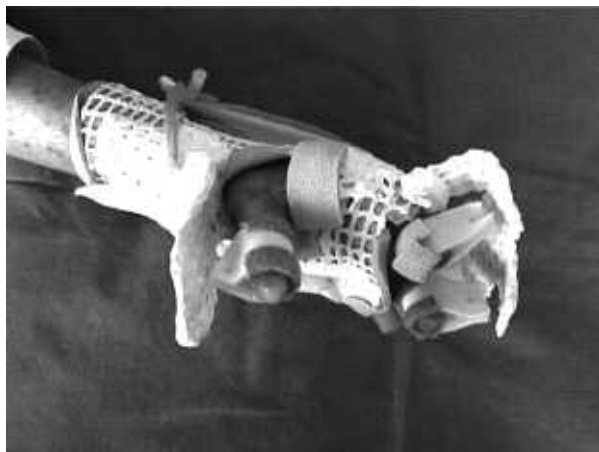
Figura 4. Tutore dinamico in estensione.